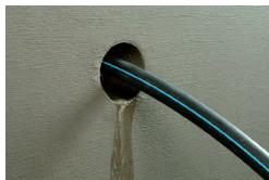
1. Eine undichte ...

KÖSTER KB-Flex 200 Dichtpaste ist dampf- und wasserdicht.