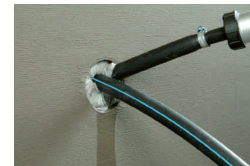
4. ... sofort, einfach,...