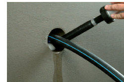
2. ... Kabeldurchführung wird...