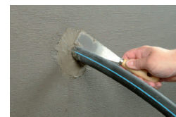
6. ... und dauerhaft abgedichtet.

KÖSTER KB-Flex 200 Dichtpaste kann auf alle mineralischen Baustoffen z.B. Beton, Mauerwerk, Mörtel und Putz aufgebracht werden. Es verbindet sich zudem mit Keramiken und Plastik wie etwa PVC, Polyethylen und Polypropylen. Der Untergrund kann trocken, feucht oder nass sein. Er muss tragfähig sein sowie frei von Fetten, Teer und Öl sowie von losen Verschmutzungen oder anderen Ablagerungen.