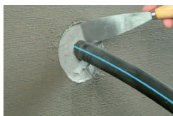
5. ... bequem...